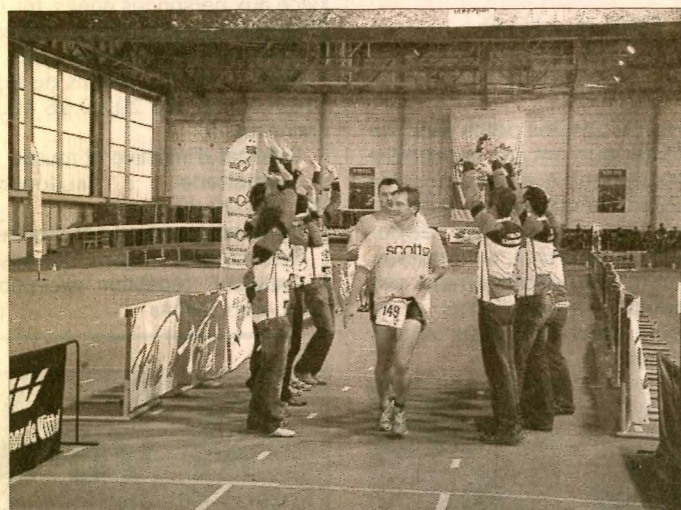
L'ambiance d'une arrivée au triathlon et en particulier à l'Aquathlon est toujours un moment solidaire.

Carton plein pour la onzième édition de l'Aquathlon, tant sur le plan des triathlètes ou des duathlètes, que sur la fréquentation du public. Preuve en est avec la course des "patrons" qui a battu son record de participants.